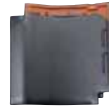
銀 嶺 3S.SILVER BLACK